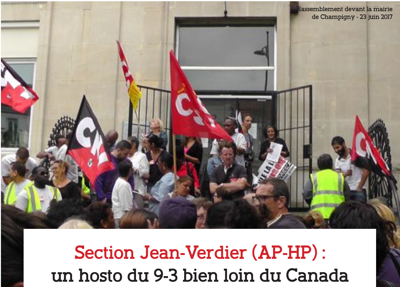
Rassemblement devant la mairie de Champigny - 23 juin 2017