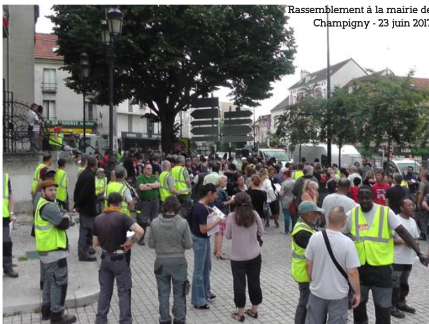
Rassemblement à la mairie de Champigny - 23 juin 2017

Seul le rapport de force pourra être en mesure de faire échec au patronat. Mais pour que ce combat puisse aboutir favorablement pour les